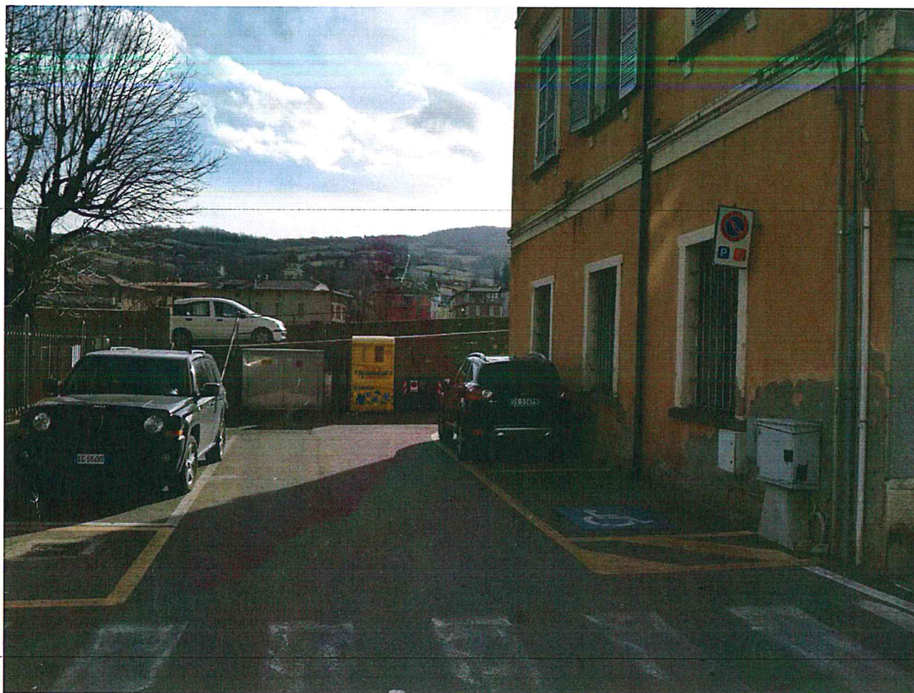
FOTO N. 1-Via S. Ambrogio manca un segnale di senso unico parallelo da installare sul lato ove è ubicato il segnale di sosta riservata ai veicoli al servizio delle persone invalide.